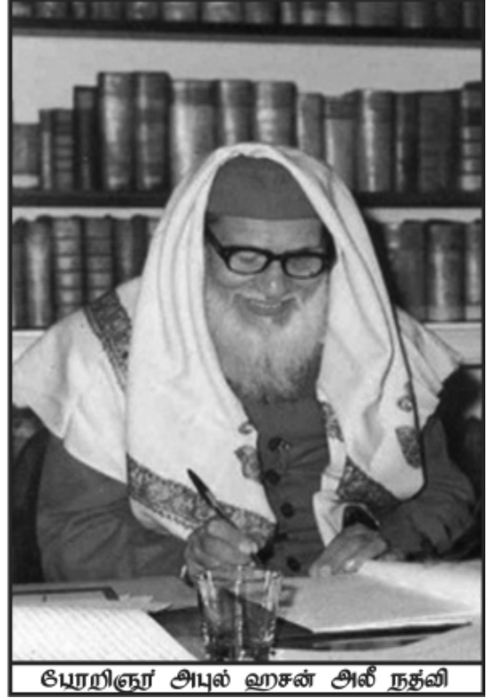
பேரறிஞர் அபுல் ஹசன் அலீ நத்வி

“போர் செய்யக் கூடாது” என்று விலக்கப்பட்ட புனித மாதங்களை தம் மனம் போன போக்கில் மாற்றியமைத்துக்