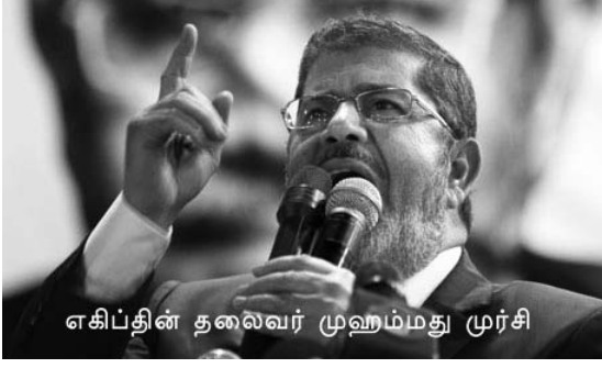
எகிப்தின் தலைவர் முஹம்மது முர்சி

வைத்திருக்க விரும்புவதாகவே இந்த கட்சி பார்க்கிறது. இருப்பினும் ஆக்கிரமிப்பாளனான இஸ்ரேல் எகிப்தையும் சேர்த்து இப்பிராந்தியத்தில் நடந்துள்ள மாற்றங்களை கண்டிப்பாக அறிந்து கொள்ள வேண்டும். கடந்த காலங்களைப் போல தற்போதும் பாலஸ்தீனியர்களை இஸ்ரேலியர்களின் ஆக்ரமிப்பு கொடுமைகளுக்கு உள்ளாக எகிப்து அனுமதிக்காது.